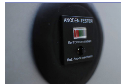
TESTER DE ÁNODO INCLUIDO