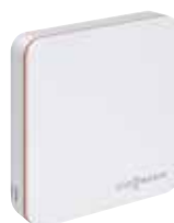
Termostato ViCare para más comodidad y eficiencia

Conectando el termostato de alta calidad ViCare, desarrollado para su uso con los sistemas de calefacción Viessmann, se puede controlar cómodamente la temperatura ambiente a través de una App. Además, la temperatura de la caldera se ajusta automáticamente a la demanda de calor, lo que ahorra energía y aumenta la vida útil.