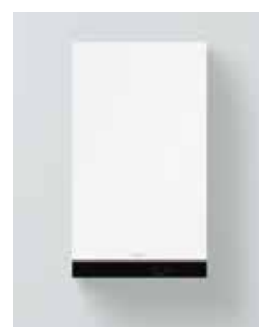
Vitodens 050-W (Modelo B0KA)

La Vitodens 050-W ha sido probada y homologada para gas natural según la normativa EN 15502. No es necesario un cambio dentro de los grupos de gas E/LL.