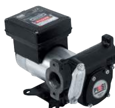
BOMBA DE CC - PANTHER DC