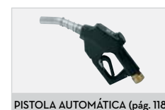
PISTOLA AUTOMÁTICA (pág. 118)