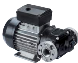
BOMBA DE CA - E80