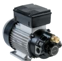
BOMBA DE CA - VISCOMAT VANE