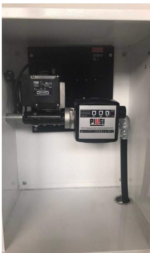
ST WITH METER