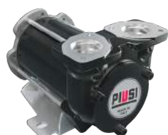
BOMBA DE CC - BYPASS 3000