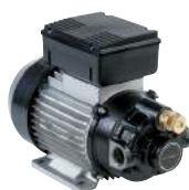
BOMBA DE CA - VISCOMAT 70/90