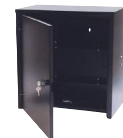
CAJA METÁLICA (opcional)