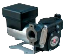
BOMBA DE CC - PANTHER DC