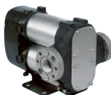
BOMBA DE CC - BIPUMP