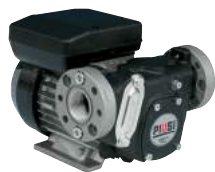
BOMBA DE CA - PANTHER 56/72