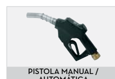
PISTOLA MANUAL / AUTOMÁTICA