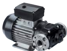
BOMBA DE CA - E80/E120