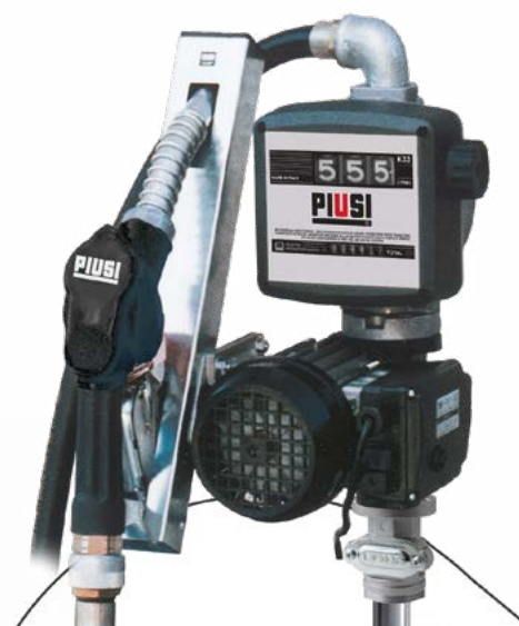
DRUM PANTHER 56 K33