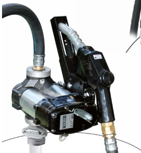
DRUM BIPUMP 12V