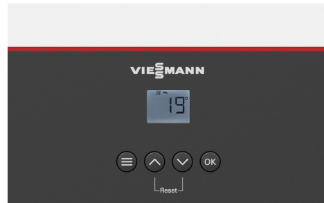
Pantalla LCD con iluminación de fondo blanca y 4 botones

Las temperaturas del agua de calefacción y del ACS pueden ajustarse rápidamente con los pulsadores de fácil manejo. Los estados de funcionamiento y las temperaturas se muestran en la pantalla digital. La caldera puede trabajar con curvas de temperatura exterior o con termostatos ambiente ON/OFF o modulantes Opentherm.