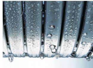
Intercambiador de calor Inox-Radial

El acero inoxidable marca la diferencia. El intercambiador de calor Inox-Radial de acero inoxidable desempeña un papel crucial en la Vitodens classic. Convierte eficazmente la energía de entrada en calor. Además, el acero inoxidable de alta calidad, es especialmente duradero y garantiza la fiabilidad.