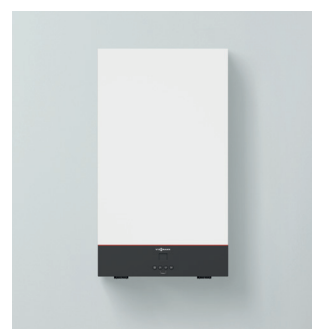
Vitodens classic (modelo BPKB)