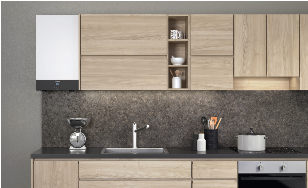
Vitodens classic con un atractivo diseño en color blanco perla Vitopearlwhite

Como fabricante a gran escala con muchos años de experiencia en la producción de calderas murales, sabemos lo que importa. La calidad de los productos Viessmann es algo en lo que puede confiar, y la Vitodens classic, con un precio muy atractivo, no es una excepción.