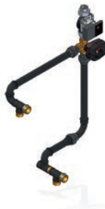
Kit hidráulico SRJ1 (HFS 30 / HFS 40 / HFS 50)