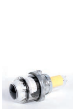
Filtro con desgasificador (Tiger Loop)