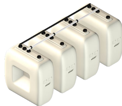
Rothalen 500 Estrecho