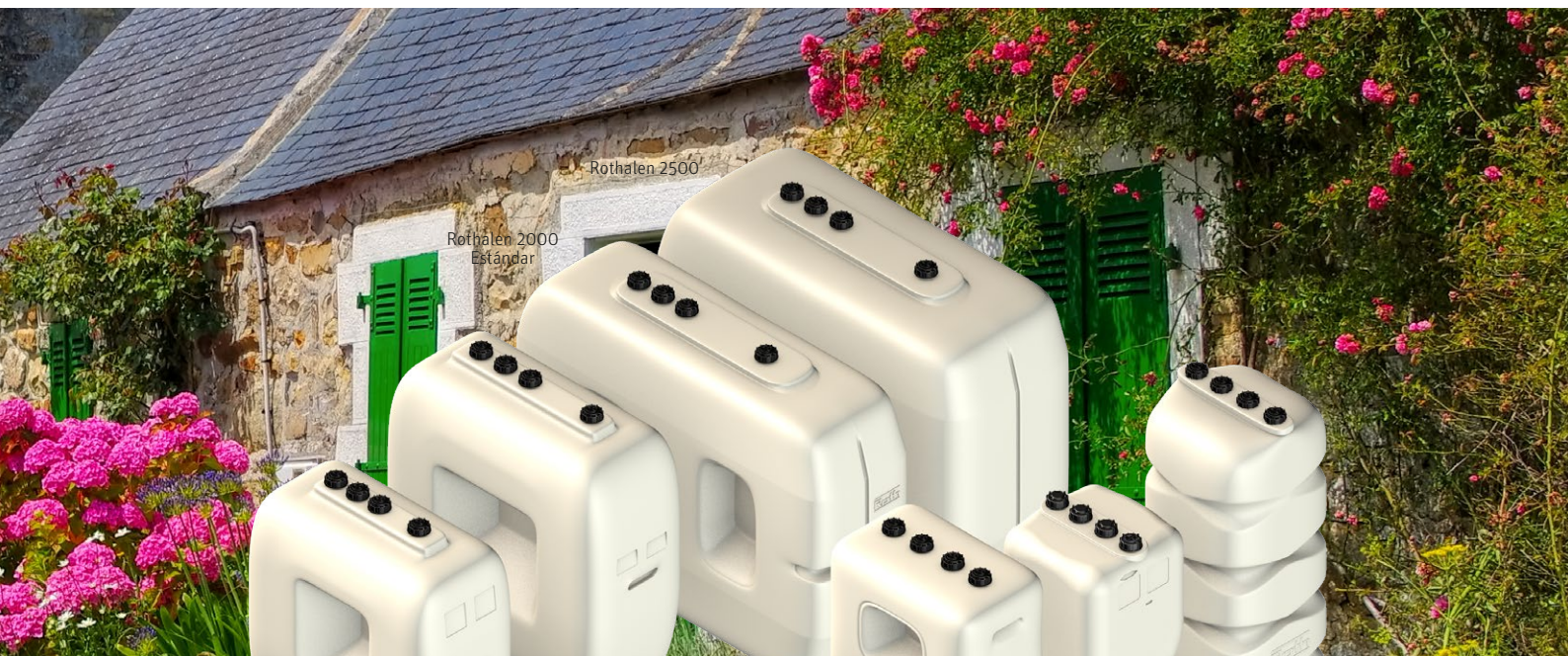
Rothalen 1000 Estándar