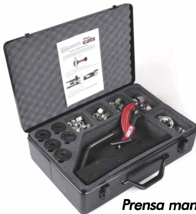
Prensa manual Cats 120