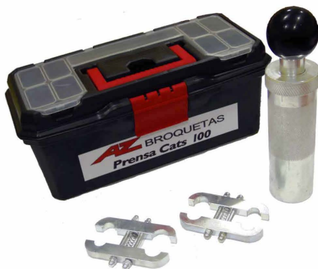
Prensa manual Cats 100